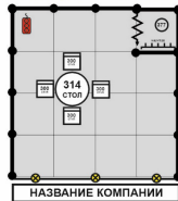
Стенд 12 - 17 кв.м. 1кВт