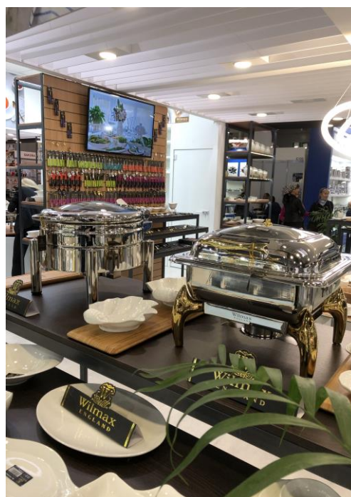
Оформление стенда компании Wilmax England на выставке HouseHold Expo 2020.