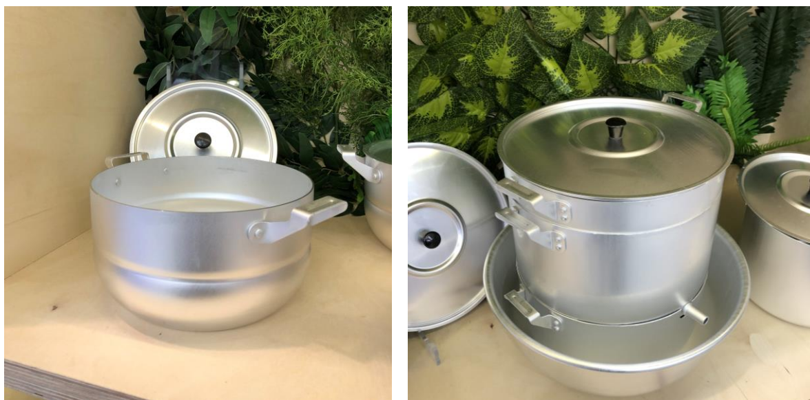
Кастрюля полусферическая с элегантной канавкой, Овощекашеварка и Таз от SCOVO.

современной дизайнерской посудой способна стать отличным дополнением к интерьеру современной кухни.