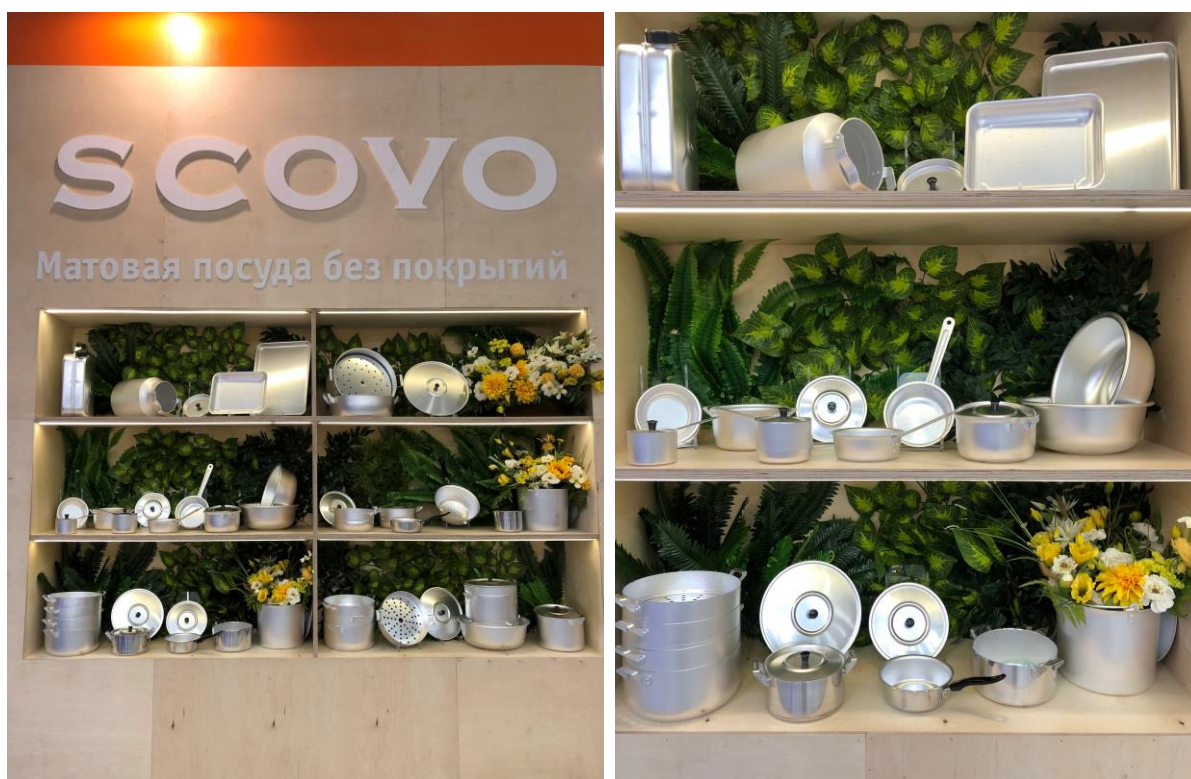
Оформление стенда компании SCOVO на выставке HouseHold Expo 2020.

Вместе с тем, компания SCOVO оригинально подошла к оформлению стенда. Дизайнер использовал деревянную фурнитуру и цветы, вероятно для того, чтобы перенести в деревенскую атмосферу, и это удалось. Получилась спокойная и приятная обстановка.