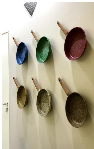
Оформление стенда компании PFLUON на выставке HouseHold Expo 2020.

Противоположным по оформлению, но не менее впечатляющим, считаю стенд компании Wilmax England. Он напомнил мне интерьер роскошной виллы с растениями и дорогой мебелью из хорошего дерева.